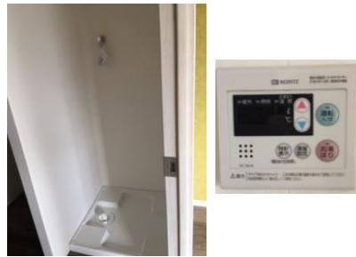
図面と現況が違う場合は現況を優先して下さい。