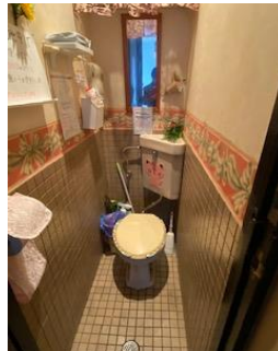
◎概略図につき現況が異なる場合は現況を優先して下さい。